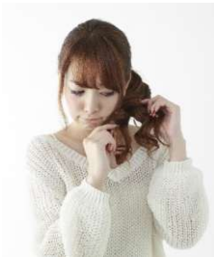
目線が大きく外れている写真