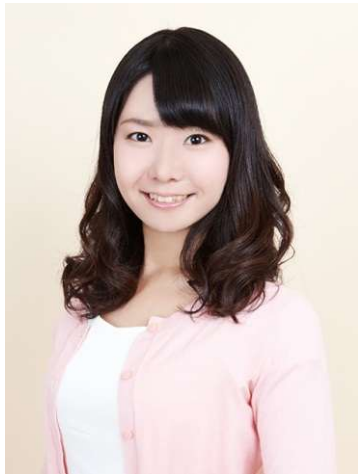
1枚目 上半身イメージ