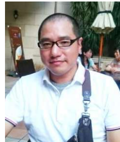
背景に他人の顔が写り込んだ写真