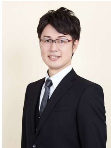
1枚目 上半身イメージ