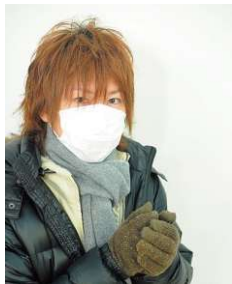
マスクで顔がわからない写真